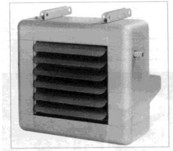
شکل ۱۳-۳- یونیت هیتر سقفی آویزی با جریان افقی هوا

۲-۳-۳- کاربرد یونیت هیتر: یونیت هیترها برای گرم کردن فضاهای بزرگ (نظیر سالن‌های ورزشی و سالن‌های کارخانه‌ها) به دلایل ذکر شده در زیر، مورد استفاده قرار می‌گیرند.